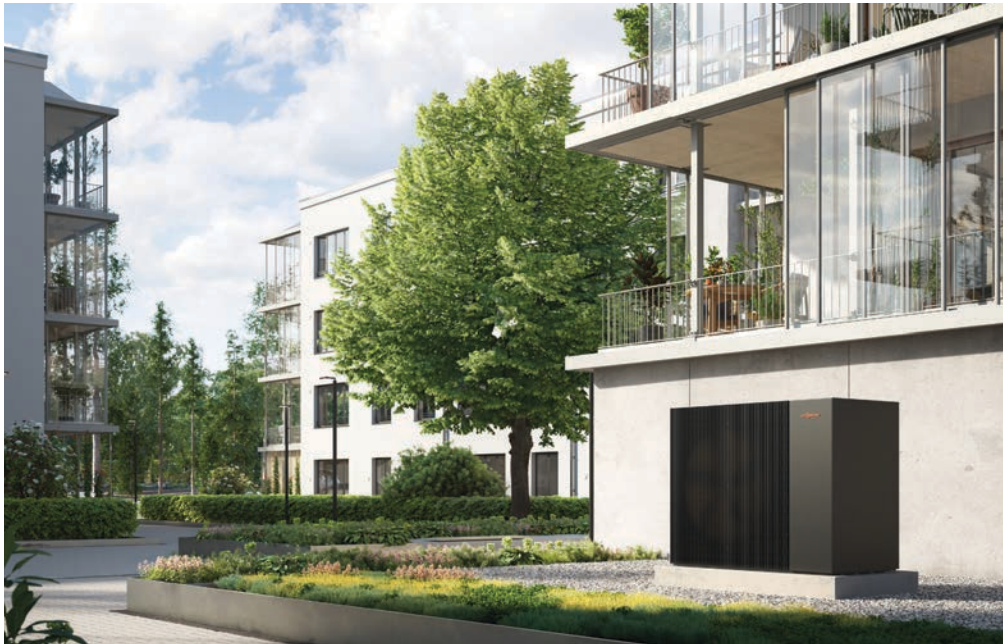
Pompe à chaleur air/eau Vitocal 250-A PRO pour un logement collectif.

Pour les logements collectifs et bâtiments tertiaires.